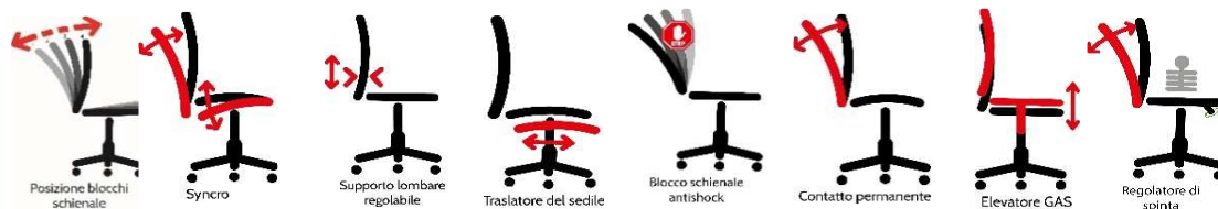
le immagini sono rappresentative dei movimenti delle sedute

Elevazione a gas; - supporto lombare regolabile ; - Meccanismo synchro tra sedile e schienale, a contatto permanente schienale con ritorno controllato da con 4 blocchi antishock; - Sedile dotato di traslatore (avanti e indietro)