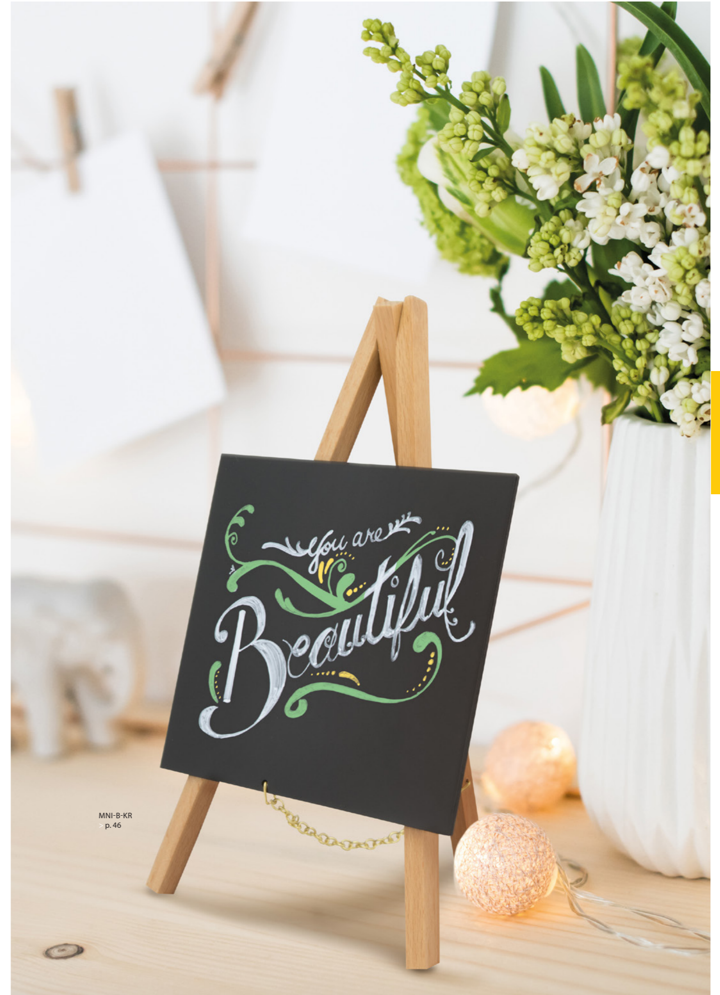
MNI-B-KR > p.46